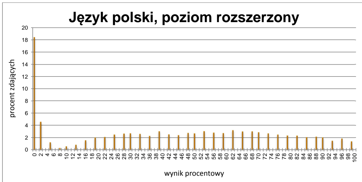
TABELA 4. WYNIKI ZDAJĄCYCH – PARAMETRY STATYSTYCZNE*