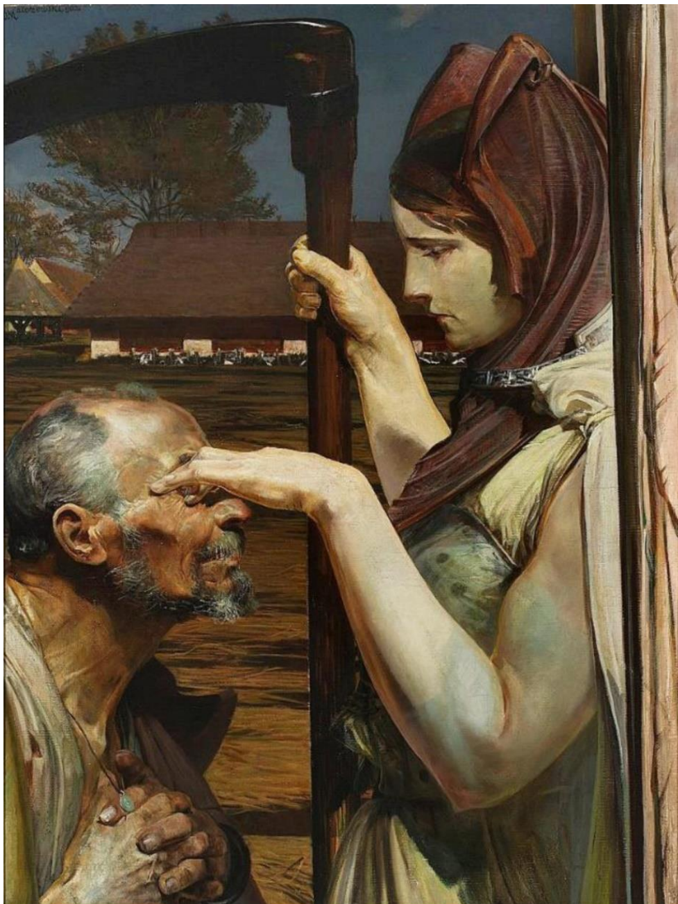
Jacek Malczewski, Śmierć , 1902, Muzeum Narodowe w Warszawie