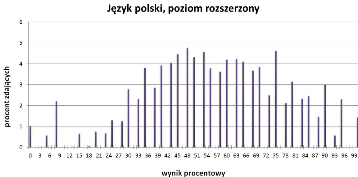
TABELA 9. WYNIKI ZDAJĄCYCH – PARAMETRY STATYSTYCZNE*