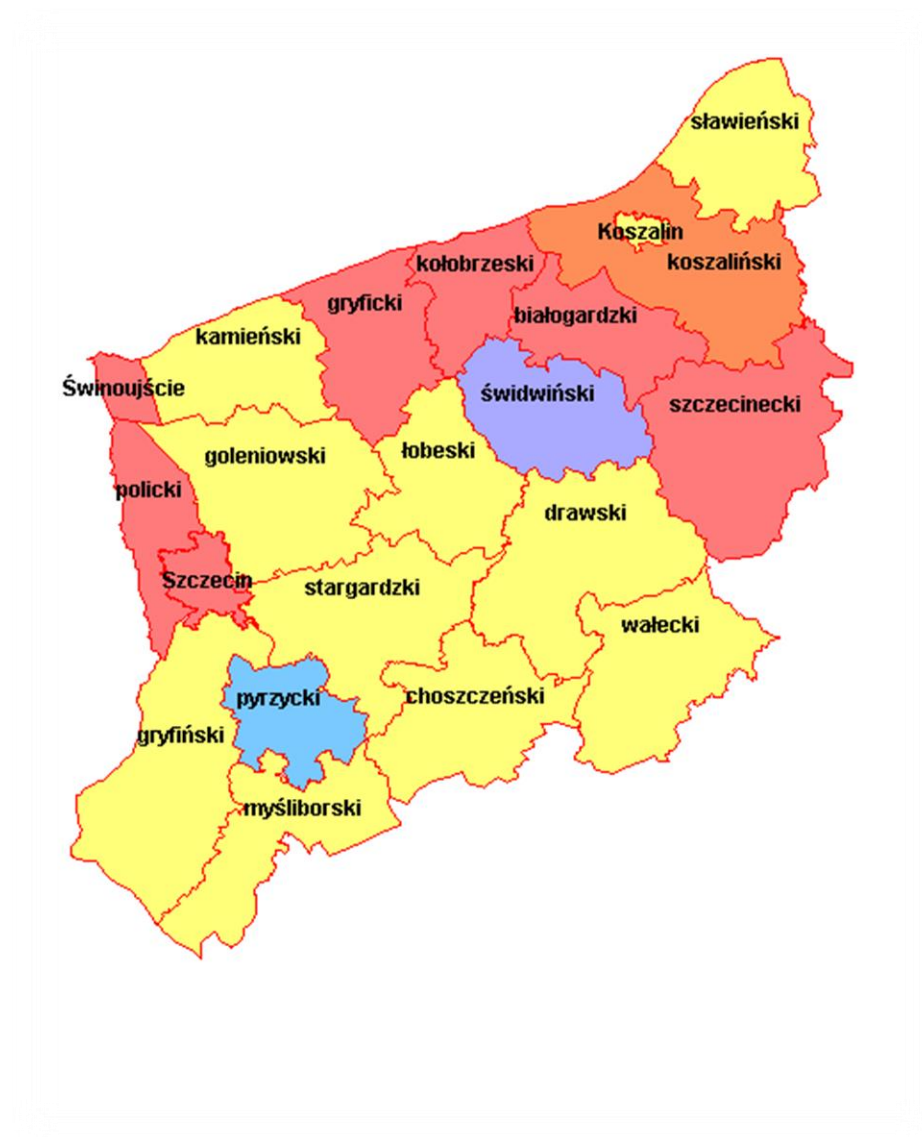
Mapa – województwo zachodniopomorskie - wyniki w powiatach (zdawalność %) – sesja styczeń-luty 2018 r.