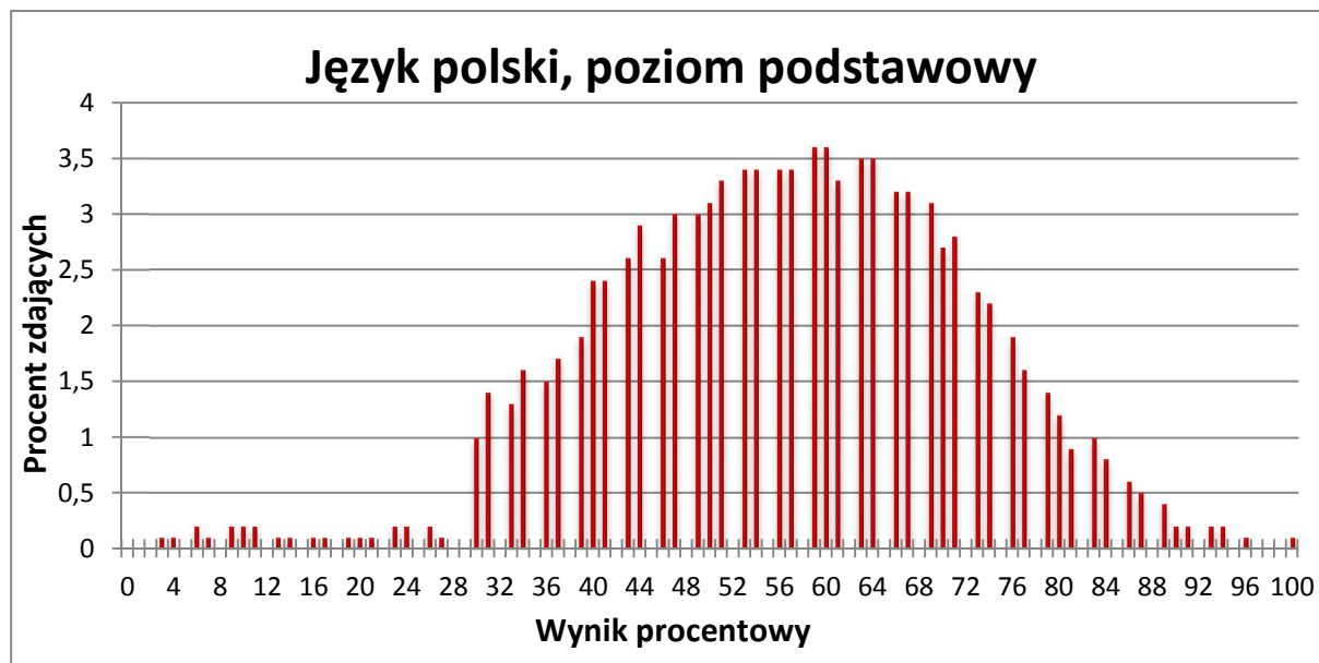
Wykres 1. Rozkład wyników zdających