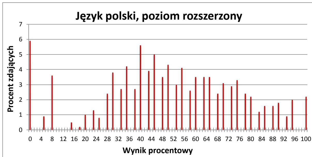
Wykres 1. Rozkład wyników zdających