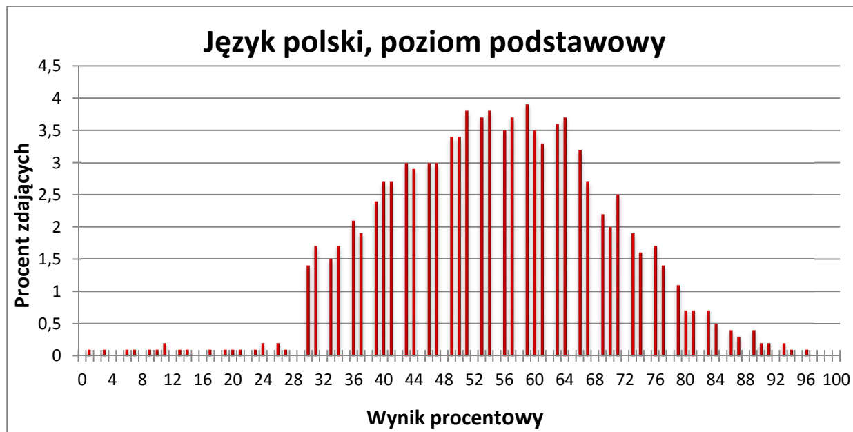
Wykres 1. Rozkład wyników zdających