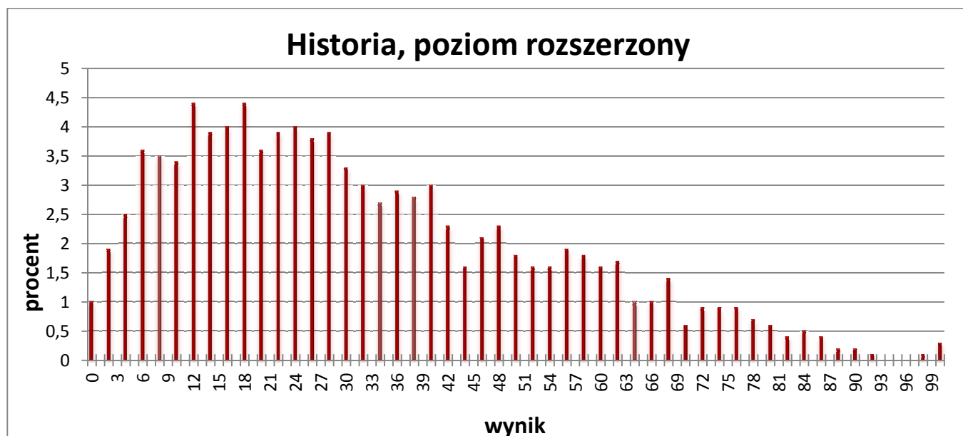
Wykres 1. Rozkład wyników zdających