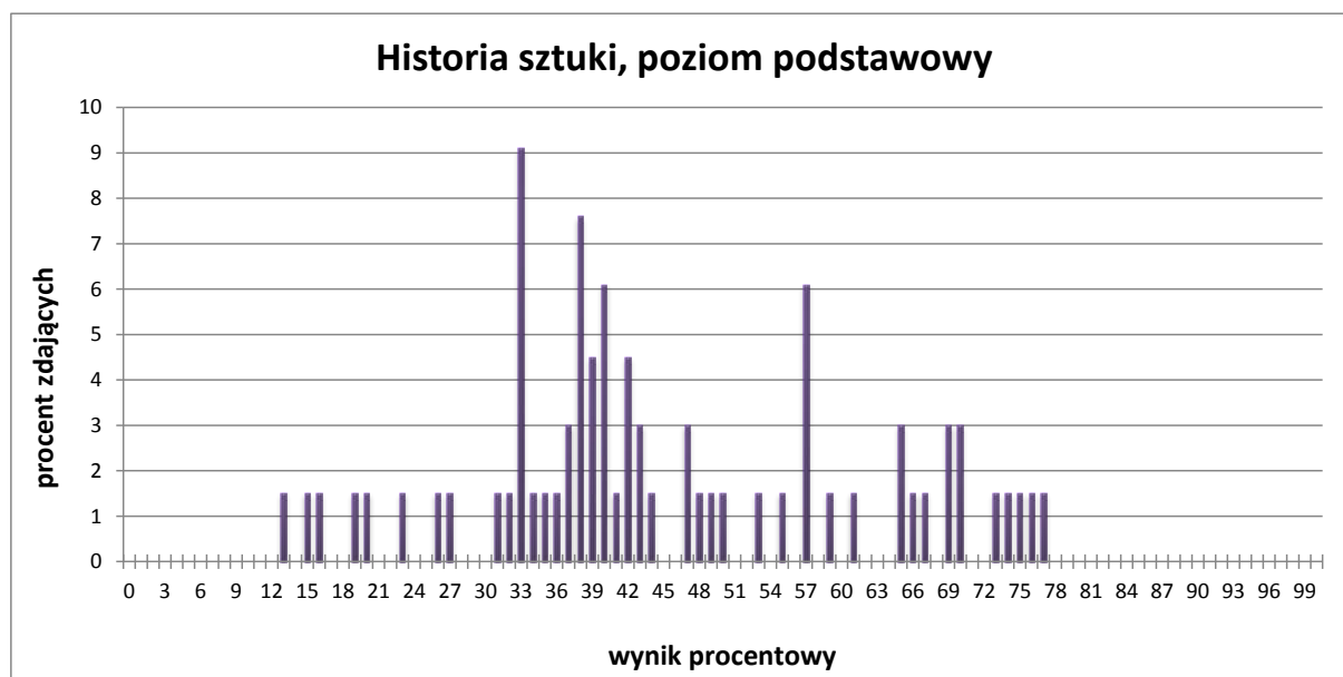
Wykres 1. Rozkład wyników zdających